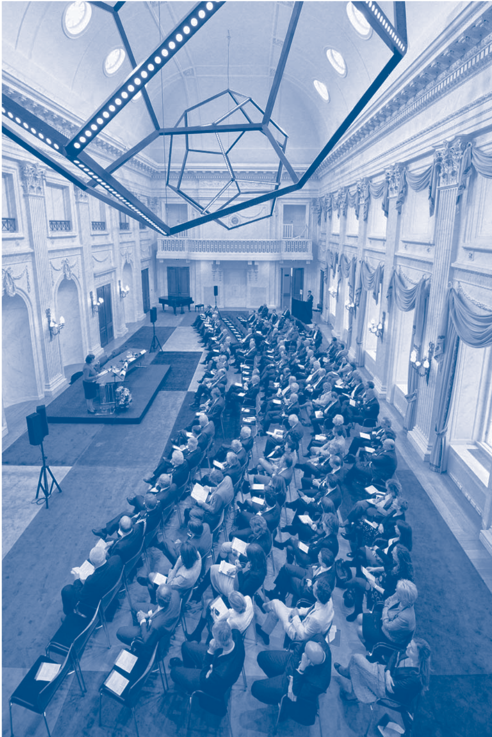
Symposium van 18 april 2012.