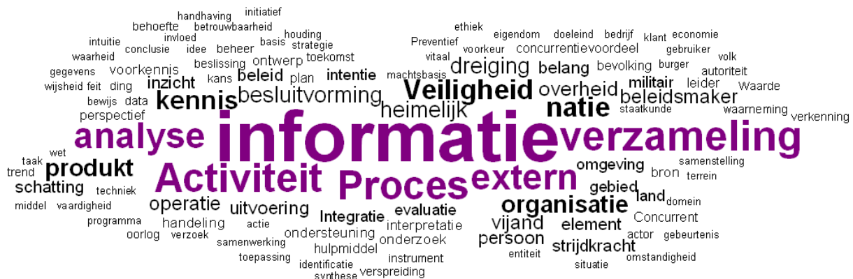
Afb.2, Een analyse van termen uit bestaande definities, een wolk van gewogen associaties met de term inlichtingen

Uit het literatuuronderzoek komt naar voren dat niet alleen de term inlichtingen ruimte voor discussie laat. Ook tal van andere termen kunnen verschillend worden uitgelegd. De gelaagdheid 'strategisch-operationeel-tactisch' wordt in politie- en marechausseekeuringen beschreven als 'strategisch-tactisch-operationeel'. Futiel totdat in een samenwerkingsverband om operationele inlichtingen wordt gevraagd of als tactische ervaring een functie-eis wordt. En, houdt een analist zich vooral bezig met synthese terwijl de analyse eigenlijk een taak van de collator is; is 'veiligheid' in deze context nu safety of security en wat is nu echt een 'bron'?