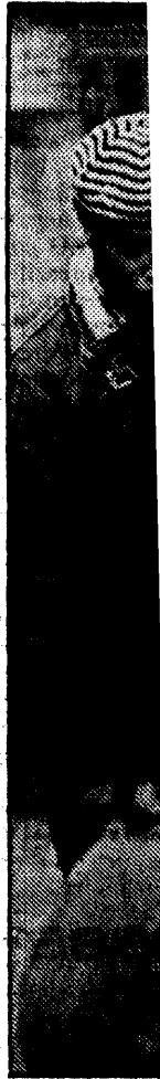
Surinamers in Bijlmer te wei

Over de schoonmaakactie tegen dealers in de Ganzenhoef zegt de nieuwe politiechef: „Ik heb tevoren aangekondigd dat wij dat zou-