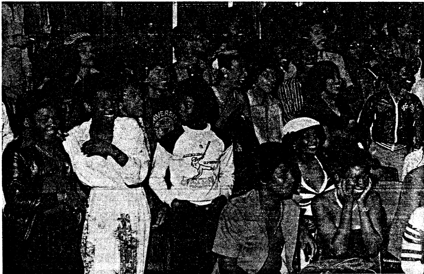
• Veel jong publiek ongedwongen bijelkaar in Ganzenhoef bij de afsluiting van de zomeractiviteiten van de S.I.B.

in Nederland hebben gevonden, kunnen dan ook niet in aanmerking komen voor een verblijfsvergunning. Zij verblijven dan vaak illegaal in Nederland. Uit een berekening blijkt, dat ruim 20.700 Surinaamse staatsburgers, zonder een verblijfsvergunning naar Nederland kwamen. Dat zou kunnen betekenen, dat zij illegaal in Nederland verblijven. Het Ministerie van Justitie kon niet bevestigen of deze cijfers geheel juist zijn, daar het erg moeilijk is exact na te gaan hoeveel illegaal zich in Nederland bevinden. Het komt dus hierop neer, dat van de ruim 40.000 Surinaamse staatsburgers, die zich na de onafhankelijkheid in Nederland hebben gevestigd ruim 19.300 kwamen in het kader van de gezinshereniging.