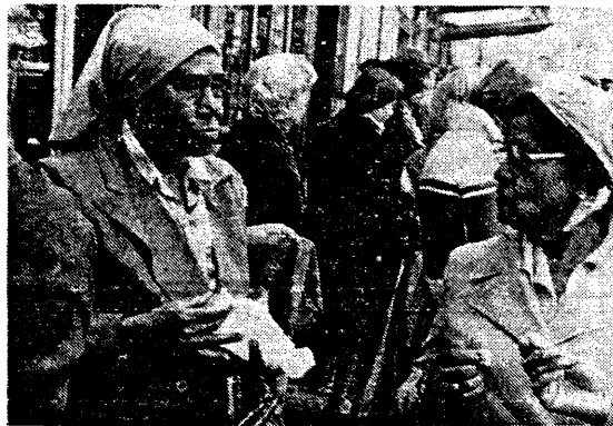
● Een "tussendoortje" bij een onvergetelijk uitstapje.

gekregen van C.R.M.; hetgeen inhoudt dat er meer kan worden ondernomen, dat er meer kan gebeuren. Daarnaast is er een innige samenwerking ontstaan met de progressieve V.P.R.O.. Vanaf 6 oktober is deze relatie "hoorbaar" geweest op Hilversum III. Op die dag is het wekelijks radioprogramma "Black star liner", dat door Bakuba wordt ingevuld, van start gegaan. Deze eerste uitzending kwam rechtstreeks vanuit de Bijlmer. In deze eerste aflevering van de "liner" werd hoe kan het anders veel Surinaamse cultuur gestopt. Ook werd de geschiedenis van de Surinaams/Antilliaanse gemeenschap via gesprekken met mensen van het eerste uur uitvoerig belicht. Het focus werd natuurlijk ook rechtstreeks gericht op het com-