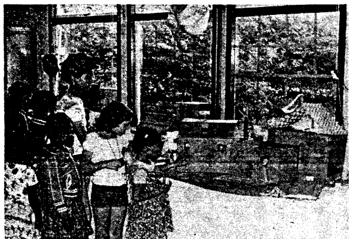
Waar het landelijke bouwprogramma voor betaalbare woningen stagneert meent de Bijlmerjeugd een voorbeeld te stellen door het bouwen van bijzonder goedkope huisjes.

Met de K.L.M. daarentegen is het prima werken geweest." En om aan te geven dat hij best tevreden is over het verloop van de charter, heeft Brown nu al meer plannen om in december opnieuw een "charter" naar Suriname te organiseren. "Ik verwacht dat ik duizend boekingen krijg", zegt hij met enig overdreven enthousiasme. Deze tweede charter zal naar alle waarschijnlijkheid in een ruimer vliegtuig worden uitgevoerd, een Super DC-8.