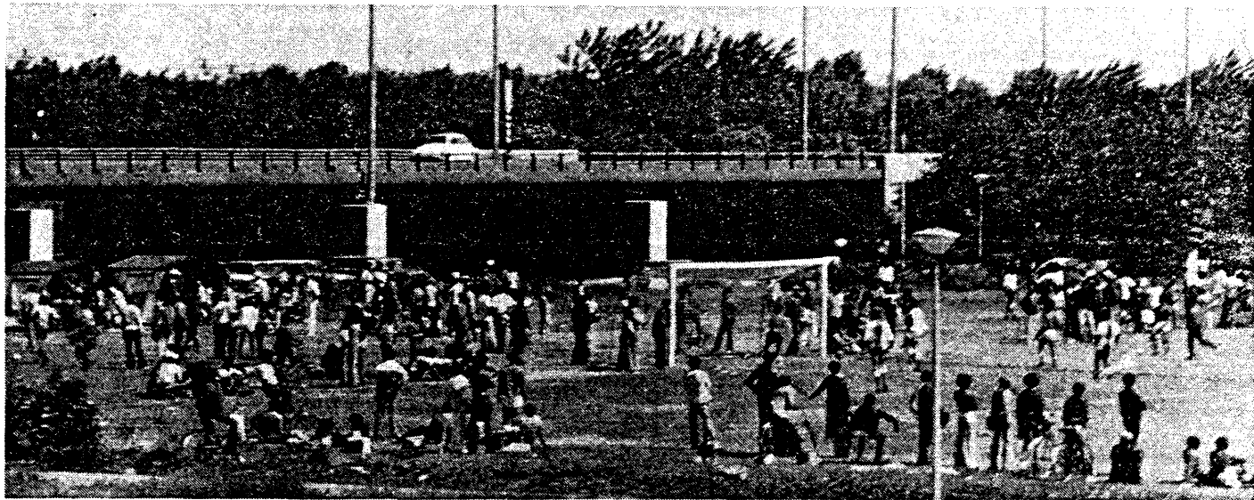
● Beeld van één van de voetbalwedstrijden in de Bijlmer. In de weekenden is dit een regelmatig terugkerend beeld. Het ziet er letterlijk zwart van de mensen. De S.V. Bijlmer is momenteel druk doende financiën te zoeken voor het opzetten van een verenigingsgebouw. U kunt misschien helpen met een bijdrage of meehelpen de acties voor financiering te ondersteunen. Voor meer inlichtingen zie advertentie elders in dit nummer.