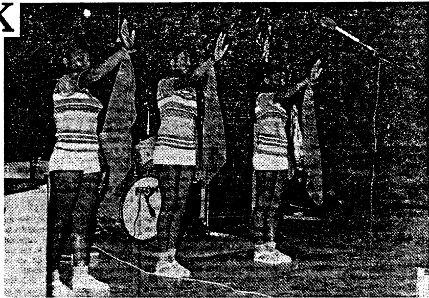
• Een dansdemonstratie van drie Surinaamse scholen.

Verder geschiedt het smokkelen van heroïne door middel van speelgoed, brieven, huishoudelijke artikelen en souvenirs. Door tips en een goede samenwerking tussen politie en de postrijen komen vele van deze gevallen aan het licht. Hafiskhan is van mening, dat de controle op de luchthaven Zanderij in Suriname veel te wensen overlaat, doordat de politie niet de beschikking heeft over modern apparatuur om de controle naar behoren uit te voeren. In dat geval zouden meerdere partijen heroïne uit Nederland worden onderschept. Nu hebben de handelaren nog vrij spel en de jongeren in de Surinaamse samenleving zijn hiervan de dupe.