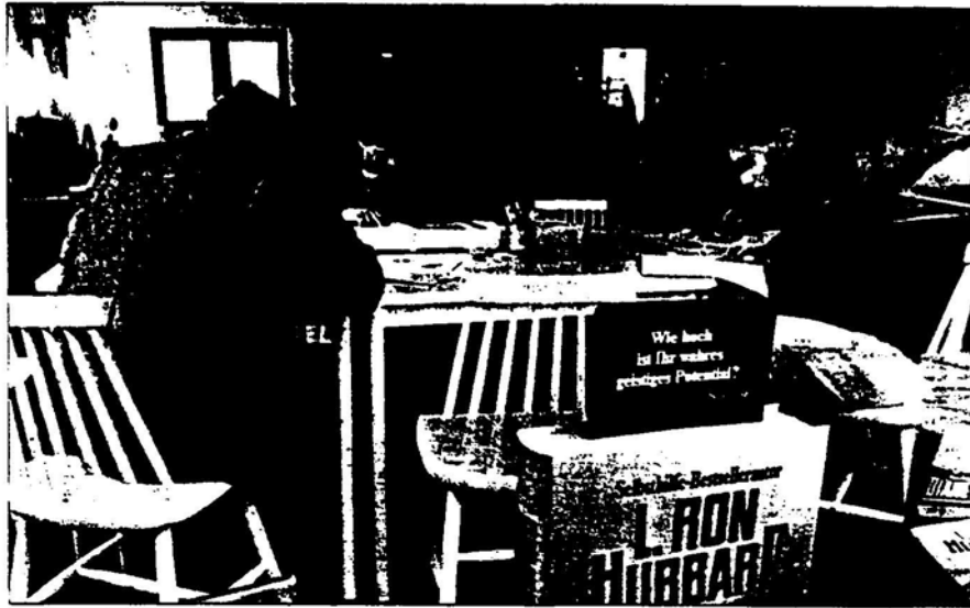
Scientology-Interessenten (in München): „Angesprochen und ausgelöscht“

„Die OCA hilft“, heißt es in einer Publikation der Sekte. „ver-