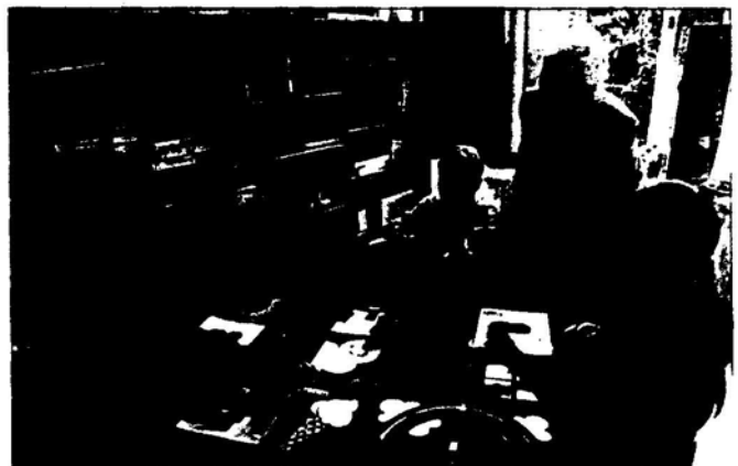
Englischunterricht in Hamburger Grundschule

ein, absolut und auch im Verhältnis zur Kinderzahl. Doch viel häufiger als auf der Straße verletzen sich Kinder im Alter von bis zu 16 Jahren bei Spiel und Sport. Das geht aus einer Untersuchung der Schweizerischen Beratungsstelle für Unfallverhütung hervor. Danach sind Schwimm-