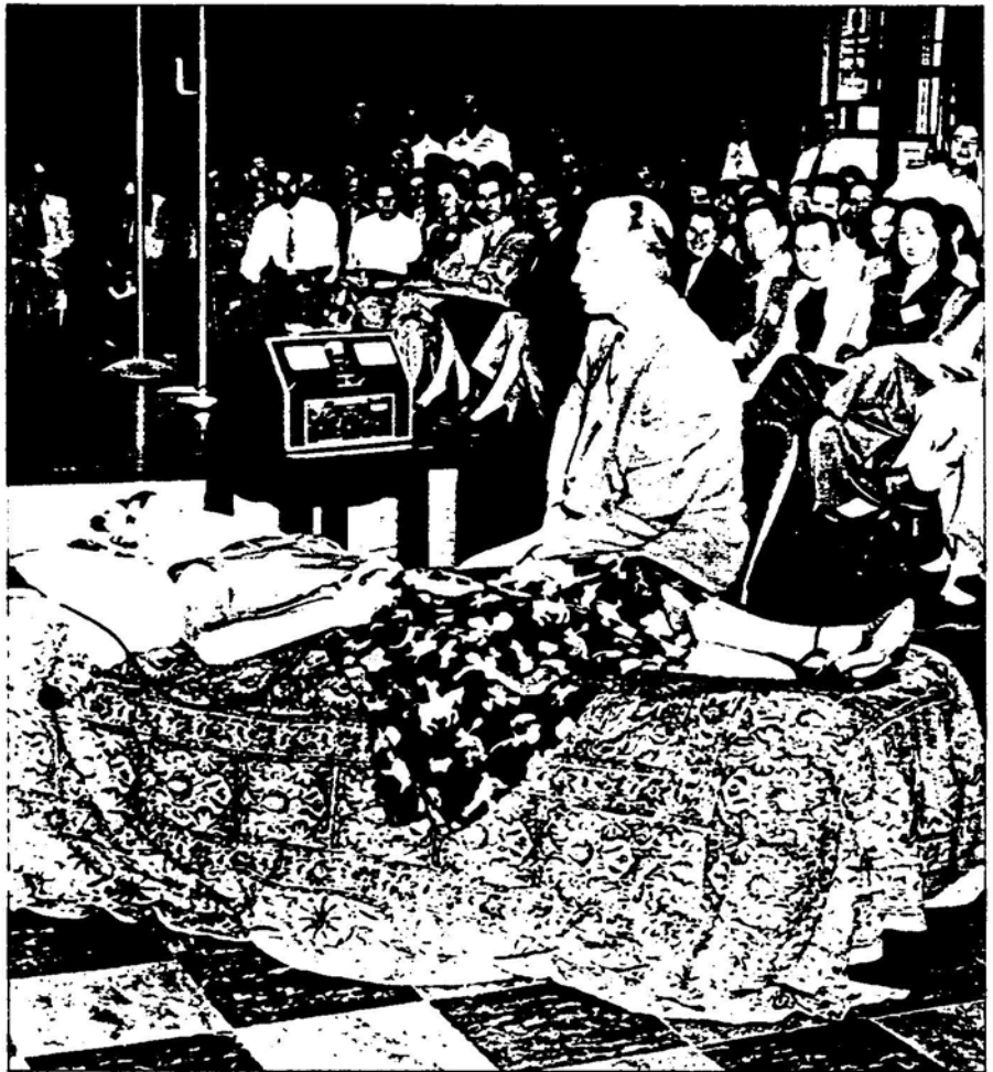
Scientology-Gründer Hubbard*: „Mit Adressen erfahrener Killer nach Bulgraviem“