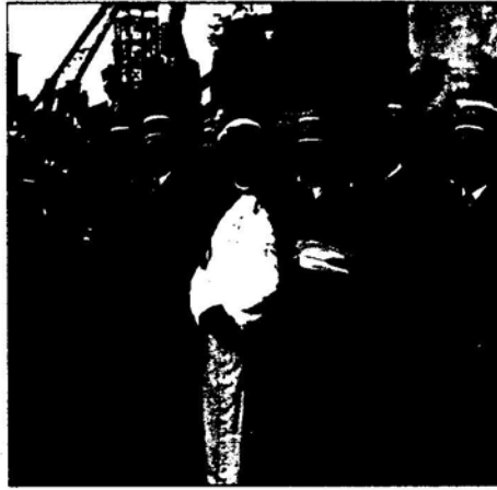
Papst Johannes Paul II. in Deutschland