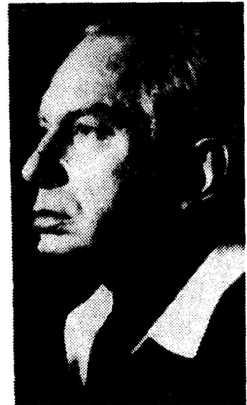
L. Ron Hubbard

In 1980 sprong de Amerikaanse overheid de kerk in de problemen met een proces dat tegen de kerk voor het Federale Hof van Berlijn begon in Los Angeles. De 1983 voerde het dat de kerk van 1970 tot 1980 een aanspraken op een beroep had gedaan op de belastingvrije status. De Afdeling-California van de kerk zou de staat een bedrag verschuldigd zijn van 10 miljoen dollar aan achterstallige belastingen.