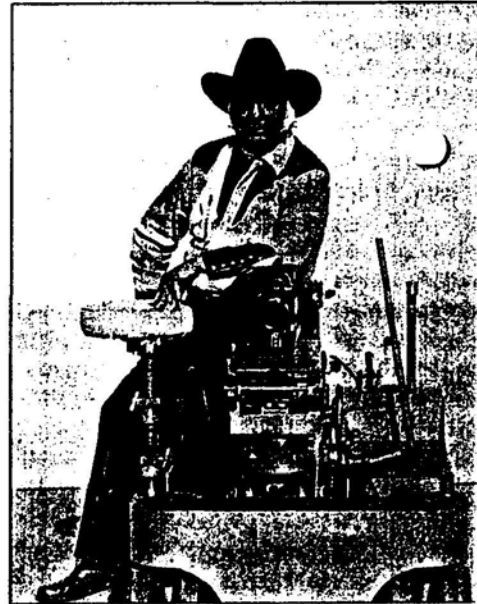
De in 1986 overleden Scientology-oprichter L. Ron Hubbard: "Geld, meer geld."