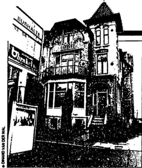
● Het pand van Narconon Nederland in Zutphen