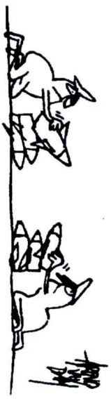
veugen, naast en bovenop de 1 biljoen dollar die al door de regering-Carter bevoort