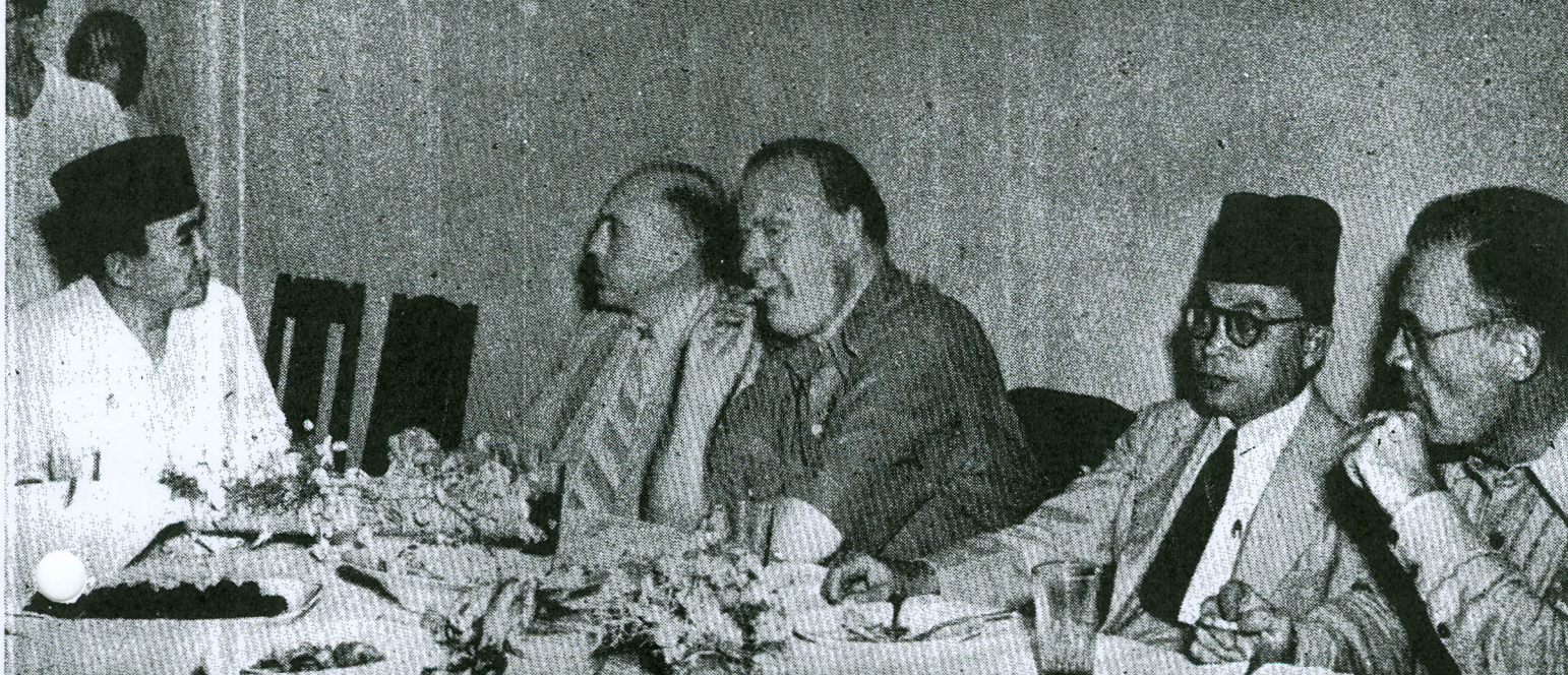
Soekarno, Schermerhorn, Lord Killearn, Hatta, van Mook aan een noenmaaltijd.

ZIJ KOZEN OOK . . . EN . . . . . DAAR WERD WAT GROOTS VERNIELD.