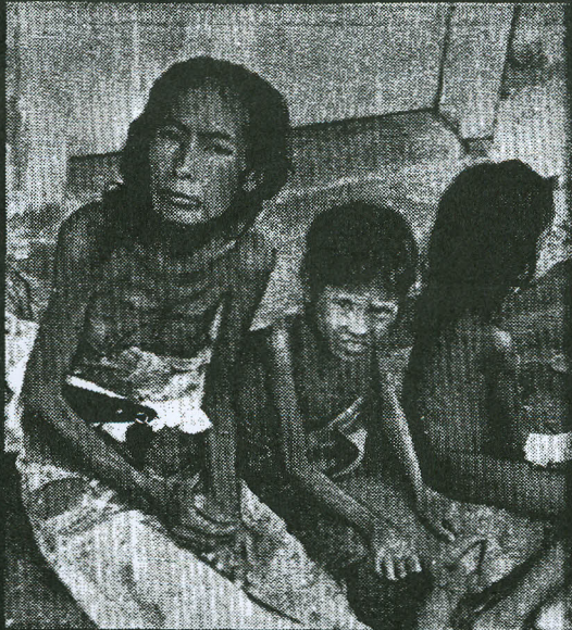
Verwoesting, honger, ziekte, verbittering en hoop. Zal Nederland geen redding brengen? (Foto: ...)

Logemann . . . . . „Onderhandelen met Soekarno is onvruchtbaar en onwaardig.“