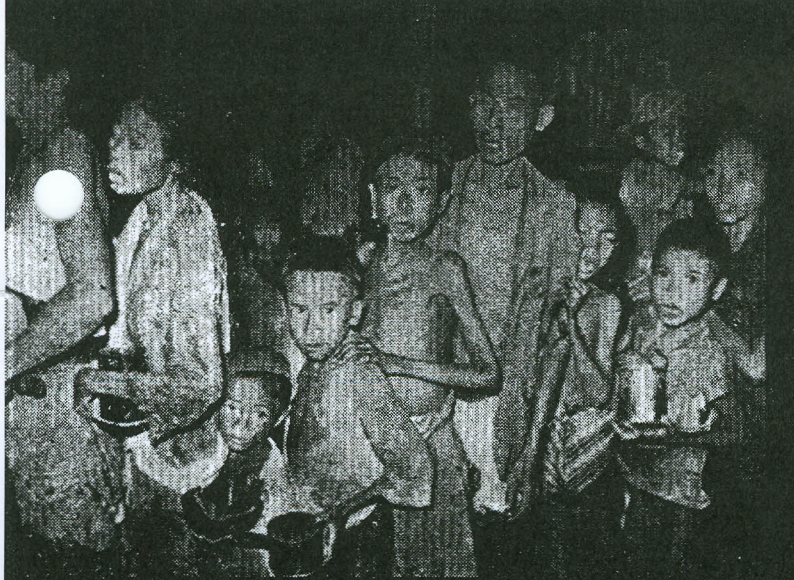
Waar Nederlandse troepen het gebied van de republikeinse „heilstaat“ binnendringen komt de uitgemergelde bevolking toegesnel . . . . .