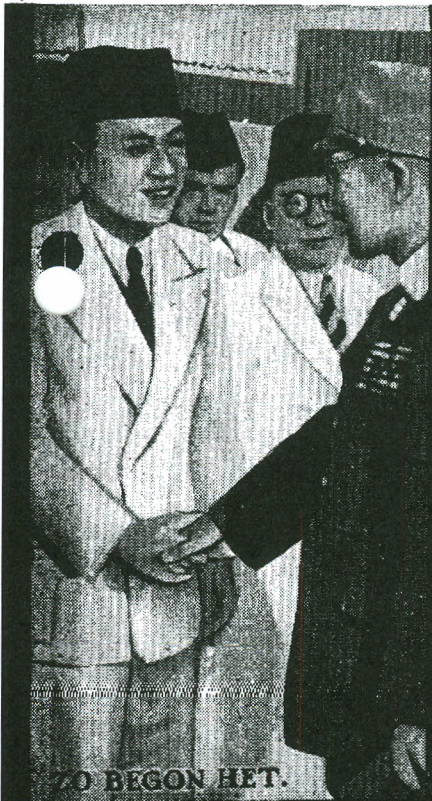
ZO BEGON HET.

De Japanse Gen. Tojo hartelijk door Soekarno verwelkomd. Op de achtergrond M. Hatta.