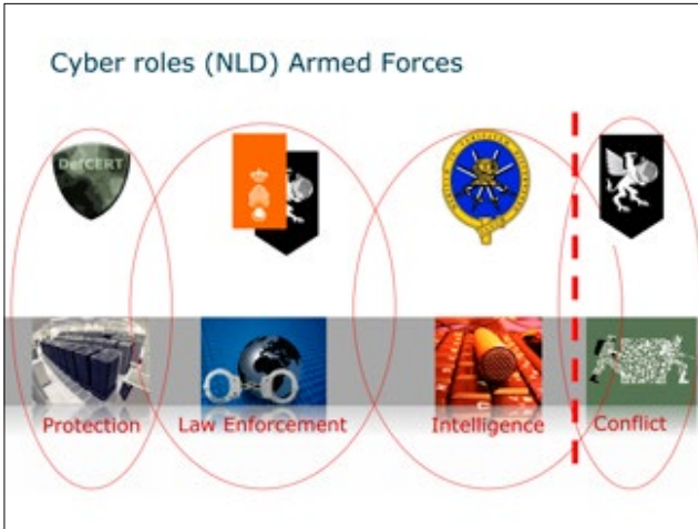
Figuur 1 Vier cyber rollen binnen Defensie