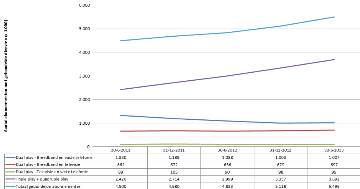
Figuur 3. Abonnementen met gebundelde diensten (bron: ACM 2013)

blijven cruciaal omdat zij de toegangspoort tot het internet en de gespecialiseerde diensten zijn.